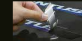
Producción de tiradas cortas de etiquetas y pegatinas

La reconocida tecnología de impresión y corte integrados de Roland ofrece la potencia y versatilidad que exige su negocio. Imprime y corta automáticamente el contorno de imágenes en cualquier forma, dentro de un flujo de trabajo fluido. Con el XR-640, puede crear una gran variedad de aplicaciones personalizadas de forma rápida, sencilla y rentable, incluyendo expositores para puntos de venta, señalización para el suelo, pegatinas, adhesivos para vehículos y transferencias térmicas para ropa.