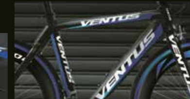
Decoración de bicicletas de carrera con adhesivos